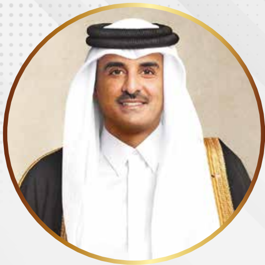
His Highness the Amir

Sheikh Tamim bin Hamad Al Thani the Amir of the State of Qatar