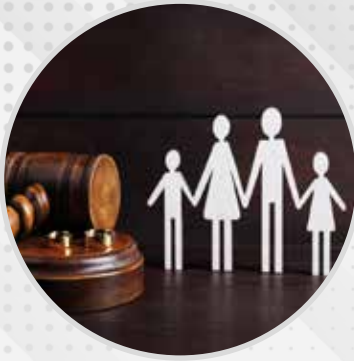
Family & Inheritance Cases