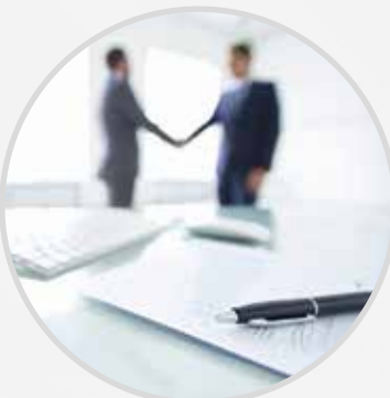
Commercial Company Incorporation