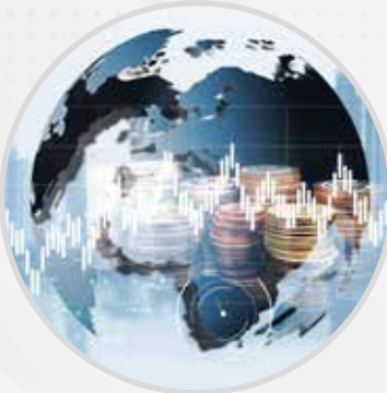
Trade & Investment Cases