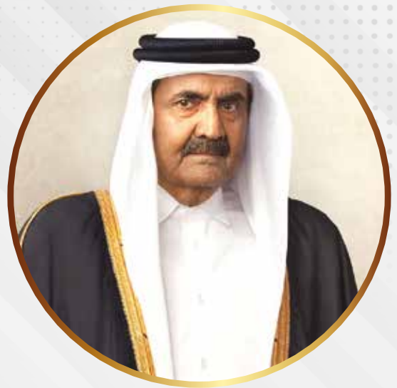
His Highness the Father Amir

Sheikh Tamim bin Hamad Al Thani the Amir of the State of Qatar